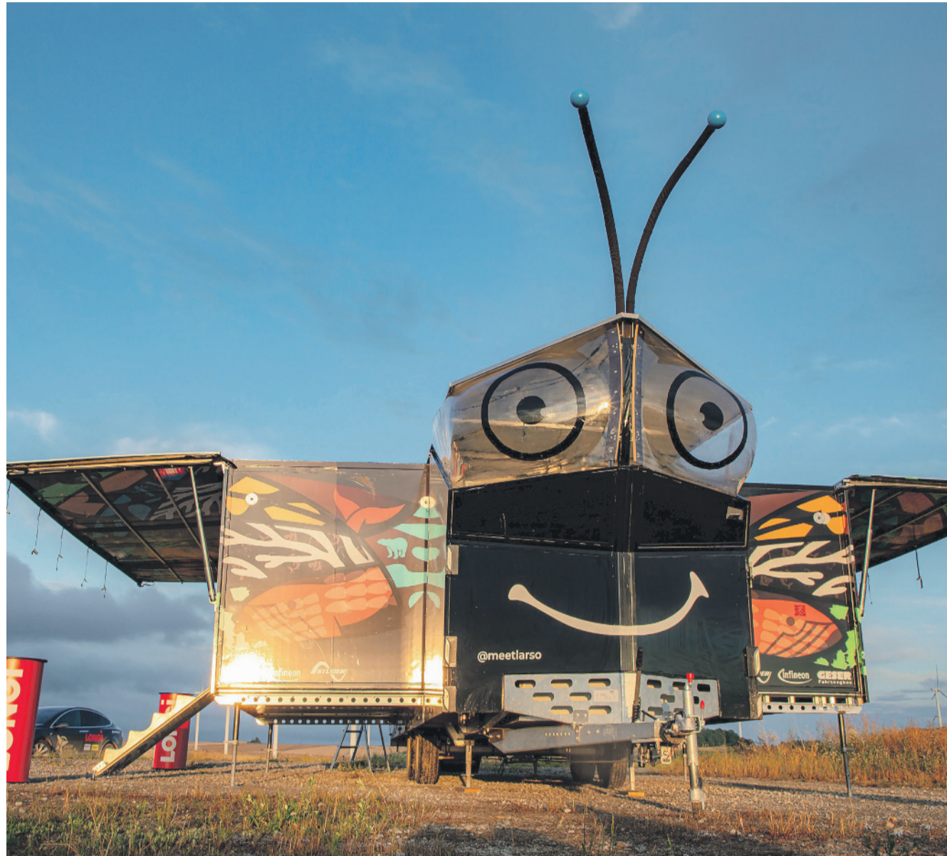
Am 19. März macht «Solarbutterfly» Halt auf dem Stadtplatz Kloten.

Programm «Kraftwerk Kloten»: www.kraftwerk-kloten.ch