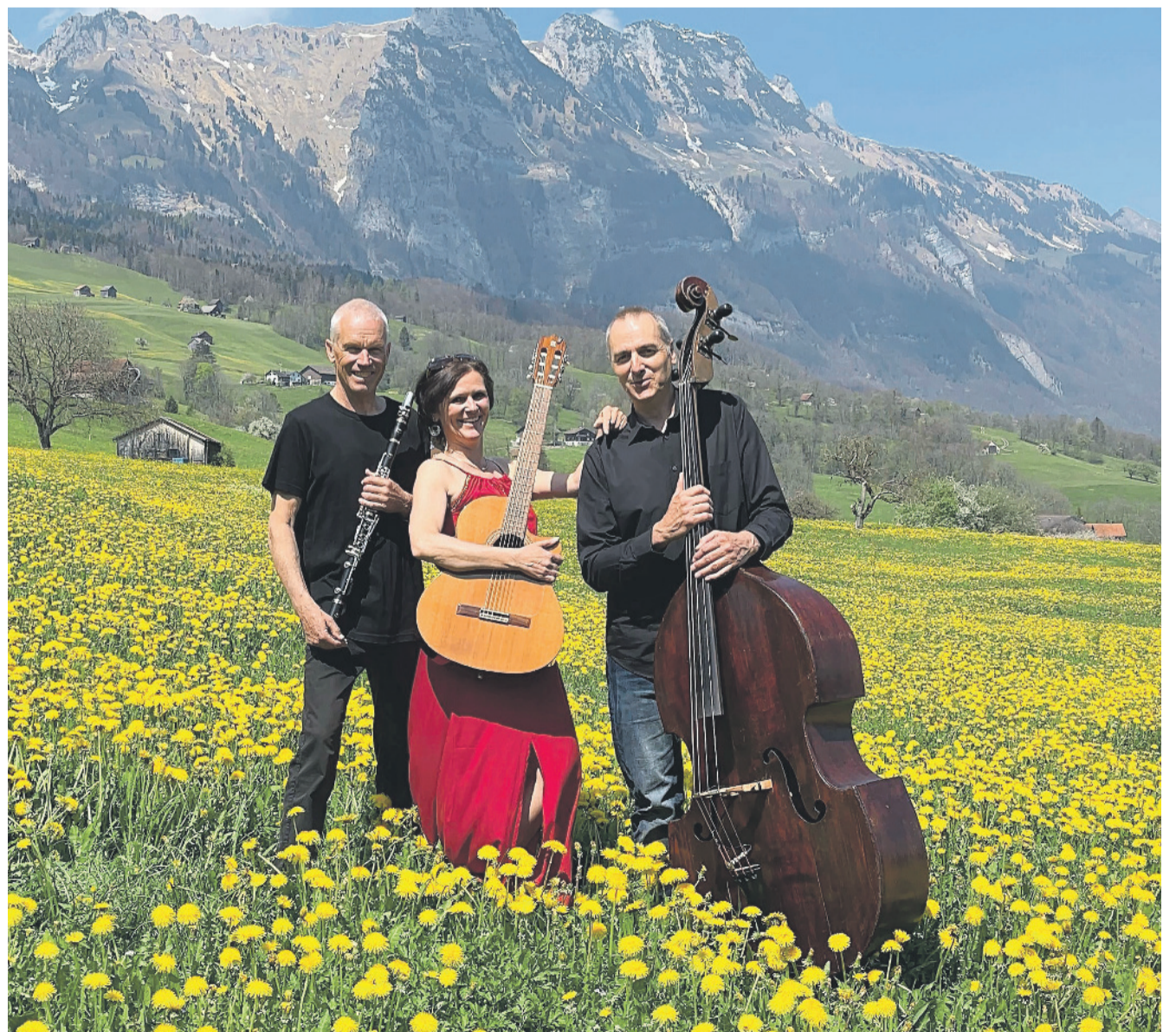
Lassen Sie sich vom Rii-Mix Trio auf eine musikalische Reise entführen.