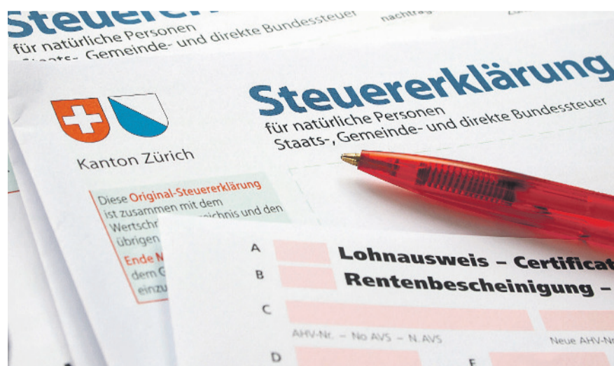
Das Steueramt Kloten gibt Tipps für einen reibungslosen Ablauf.

Die Aufforderung zur Einreichung der Steuererklärung und des Verrechnungs-