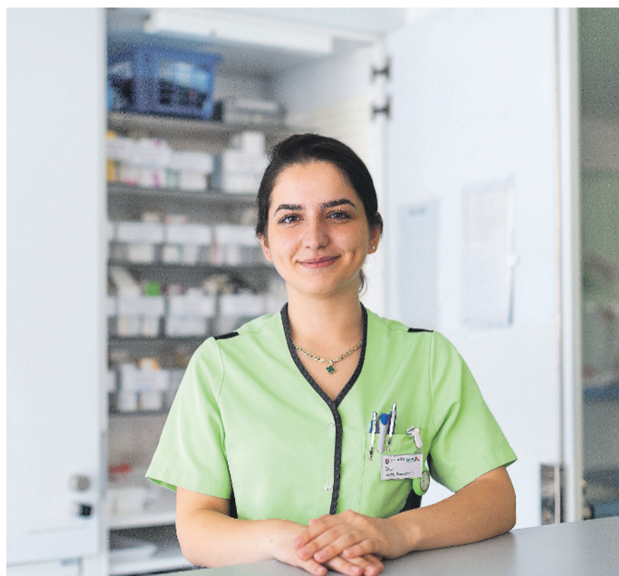
Mitarbeitende des Pflegezentrums im Spitz sowie der Spitex Kloten werden am Infotag der Gesundheitsberufe im ZAG Rede und Antwort stehen.

Weitere Informationen: www.puls-berufe.ch/zurich/veranstaltungen/zuercher-infotage-gesundheitsberufe-2024 und www.zag.zh.ch/ .