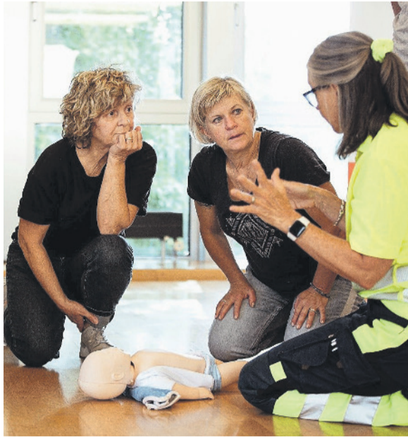
Ob Osterbasteln, Erste-Hilfe-Kurse oder Yoga – im Kursangebot der VFK ist bestimmt für jeden/jede etwas dabei.