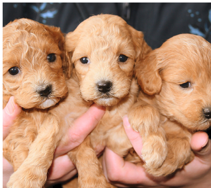
Hunde müssen innerhalb von 10 Tagen bei der Einwohnerkontrolle angemeldet werden.

Allfällige Mutationen über Tierhalterin oder Tierhalter und/oder den Hund, wie Namens- und Adressänderungen, Halterwechsel oder Todesfälle, sind ebenfalls innert 10 Tagen unter www.kloten.ch/tiere mitzuteilen. Mutationen inklusive