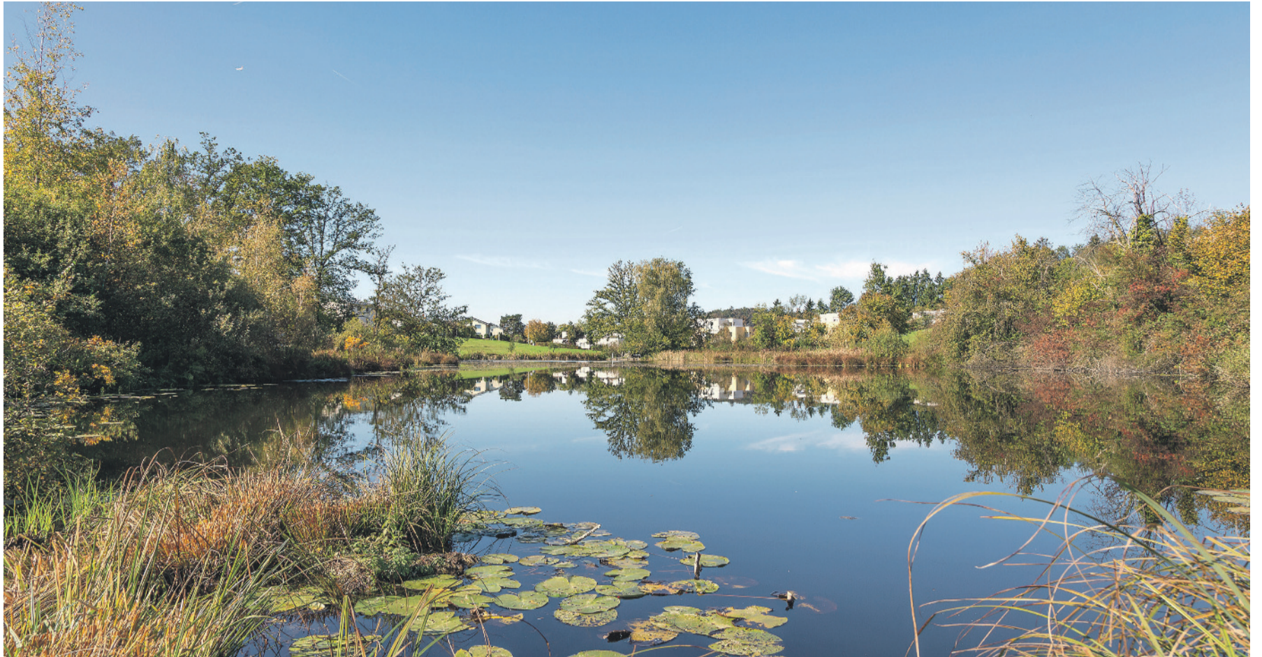
Wasser ist eine lebenswichtige Ressource.