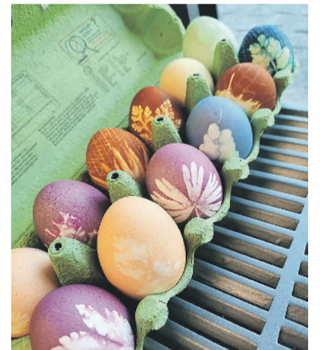
BILDER VEREINIGUNG FREIZEIT KLOTEN