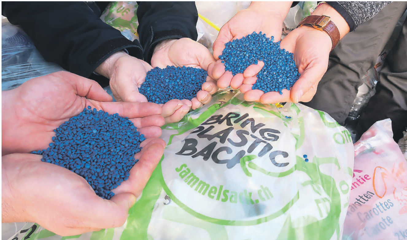
Kunststoff nachhaltig machen.

Das Sammelsystem ist nach den strengen Anforderungen des Vereins Schweizer Plastic Recycler zertifiziert. Die Zertifizierung beinhaltet ein komplettes und regelmässiges Stofffluss-Monitoring nach der Methode der Empa. Dies garantiert, dass aus dem Plastikabfall auf sinnvolle Weise neue Rohstoffe gewonnen werden. Die Kunststoffsammlung der Stadt Kloten ersetzte im stofflichen Recycling 10180 Kilogramm Neumaterial, was 30540 Liter