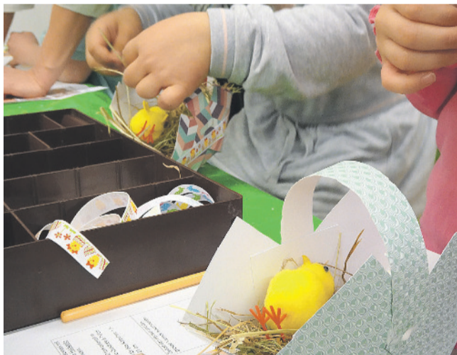
Das Zentrum Schluefweg verwandelt sich am 27. März in eine Osterwerkstatt für Gross und Klein.

Weitere Informationen zur Wasserversorgung und Wassernutzung in Kloten: www.ibkloten.ch