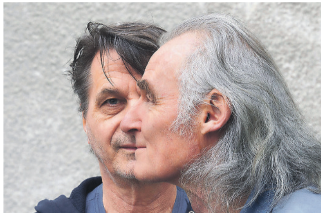
Marflix spielt im Bücheler-Hus

Weitere Informationen: www.sammelsack.ch